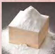
国産小麦粉を 100%使用