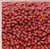
北海道十勝産 「エリモ小豆」を 100%使用